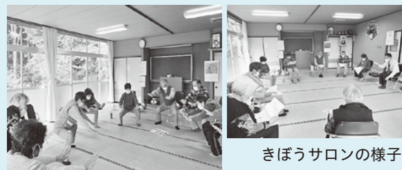
きぼうサロンの様子

また「きぼうサロン」では、地区の集落センターを会場に、週に一度サロンを開催し、ラジオ体操や脳トレ運動を行っています。会員の皆さんから「膝や腰の痛みがなくなり元気に年を重ねている」「楽しみにサロンに出かけることは、認知